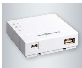
Moduł Vitoconnect 100 (w zakresie dostawy kotła) umożliwia zdalny nadzór i sterowanie instalacją grzewczą przez internet za pomocą aplikacji mobilnej ViCare.

Wysoko sprawny gazowy wiszący kocioł kondensacyjny z ładowanym warstwowo zasobnikiem c.w.u., o pojemności 46 litrów.