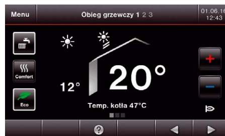
Nowy elektroniczny regulator Vitotronic 200 z kolorowym wyświetlaczem dotykowym

Decydując się na jeden z kotłów Vitodens użytkownik może liczyć na niskie koszty instalacji i serwisu. Wszystkie podzespoły kotła są dostępne od przodu, zbędne są boczne odstępy serwisowe. Dostarczane urządzenie jest w pełni zmontowane i nie wymaga od instalatora montowania wewnątrz żadnych dodatkowych elementów. A przez zawieszenie kotła na uchwycie ściennym przyłącza się równocześnie, szczelnie i pewnie, wszystkie złącza wodne – bez przykręcania, zaciskania lub lutowania.