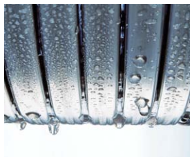
Wymiennik ciepła Inox-Radial – trwały i efektywny