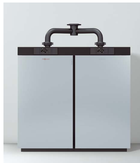
Kompaktowe rozwiązanie kaskadowe – instalacja dwukotłowa w jednej obudowie, o mocy od 400 do 640 kW

Zintegrowany regulator Vitotronic w opcji stałotemperaturowej lub pogodowej, z funkcją asystenta uruchomienia pozwala na wygodne skonfigurowanie instalacji podczas rozruchu, oraz późniejszą obsługę przez użytkownika. Układ kaskadowy opiera się na nadrzędnym regulatorze Vitotronic 300-K MW1B komunikującym się z kotłami w systemie LON. Oznacza to, że zarówno nowe instalacje jak już te istniejące można rozbudowywać o kocioł Vitocrossal 100 C11. Regulator kaskadowy Vitotronic 300-K (MW1B) umożliwia sterowanie kaskadą, złożoną z czterech kotłów.