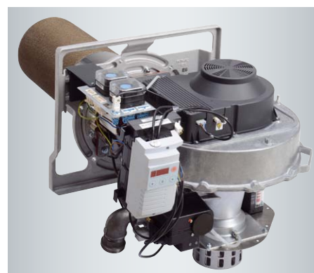
Palnik cylindryczny Matrix

Kocioł kondensacyjny może pracować niezależnie od powietrza z pomieszczenia, co pozwala na jego elastyczne ustawienie w budynku.