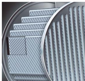
Powierzchnia grzewcza Inox-Crossal zapewnia efektywną wymianę ciepła i współczynnik kondensacji

Dzięki zaawansowanej technologii kondensacji Vitocrossal 200 jest oszczędnym kotłem grzewczym o różnorodnym zastosowaniu.