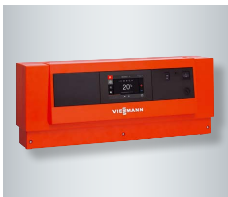
Sterowany pogodowo regulator kotła i obiegu grzewczego Vitotronic 200, typ CO1E