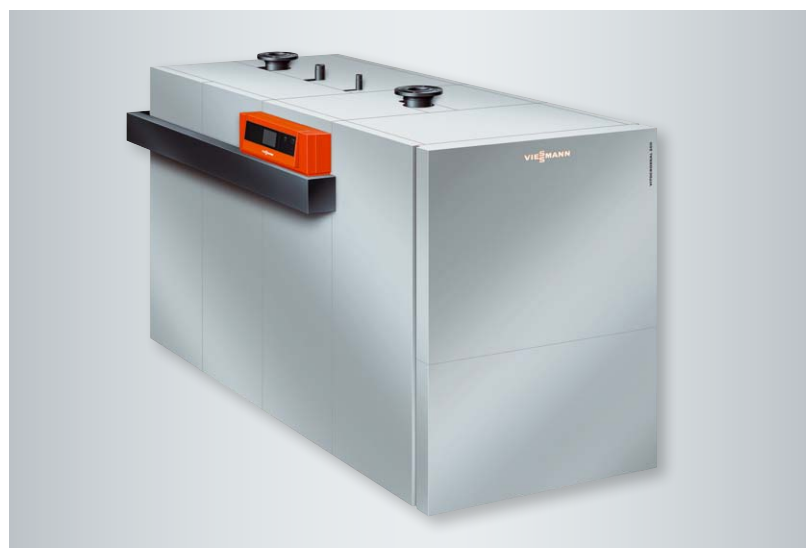
Gazowy kocioł kondensacyjny Vitocrossal 200, typ CM2

Wysoka sprawność wymiany ciepła i wysoki współczynnik kondensacji umożliwiają osiągnięcie sprawności normatywnej dochodzącej do 97% (H 2 )/108% (H 1 ).