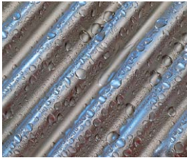
Powierzchnia wymiany ciepła Inox-Crossal z kwasoodpornej stali szlachetnej