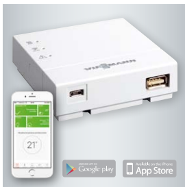
Moduł Vitoconnect 100 (w zakresie dostawy kotła) umożliwia zdalny nadzór i sterowanie instalacją grzewczą przez internet za pomocą aplikacji mobilnej ViCare.

Szczegóły dostępne na stronie: www.viessmann.pl/gwarancja