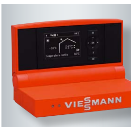
Regulator Vitotronic 200 (typ KW6B) z przejrzystym menu obsługowym

Najbardziej zaawansowana technika – ten gazowy kocioł kondensacyjny spełnia wszystkie oczekiwania.